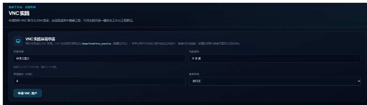
图：VNC 实践 — VNC 实践环境申请